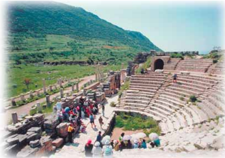
Die Gemeinde der Stadt Ephesus, in der heutigen Türkei gelegen, ist die erste von sieben Gemeinden in Offenbarung, Kapitel 2-3. Zur Zeit des Johannes gedieh die Stadt, die im Neuen Testament mehrmals erwähnt wird.

Christus warnt auch vor Irrlehrern. Er weist die Gemeinde in Thyatira zurecht, weil sie Isebel duldeten, „diese Frau, die sagt, sie sei eine Prophetin, und lehrt und verführt meine Knechte, Hurerei zu treiben und Götzenopfer zu essen“ (Vers 20). Die Gemeinde in Ephesus wird ebenfalls von denen umworben, „die