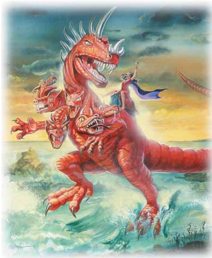
In einer Vision sah Johannes eine in Scharlach gekleidete Frau, die auf einem Tier mit sieben Häuptionen und zehn Hörnern saß. Diese Frau stellt ein falsches religiöses System dar, das in der Zeit vor Jesu Wiederkehr die Verfolgung und Ermordung wahrer Christen veranlassen wird.

Sie wird sich zu einer enormen Stadt der treuen und gehorsamen Diener Gottes entwickeln – der unvergänglichen heiligen Stadt des neuen Jerusalems. Sehen Sie hier Gottes letzte Warnung: „Und wenn jemand etwas wegnimmt von den Worten des Buchs dieser Weissagung, so wird Gott ihm seinen Anteil wegnehmen am Baum des Lebens und an der heiligen Stadt, von denen in diesem Buch geschrieben steht“ (Offenbarung 22,19).