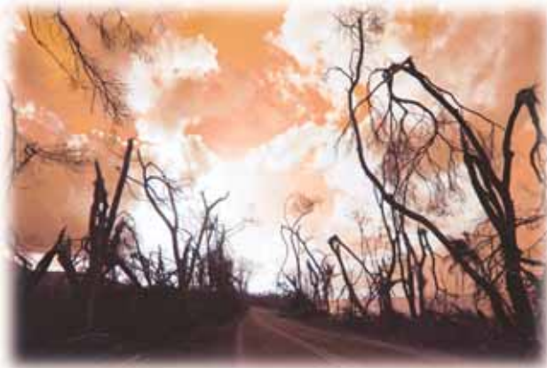
Eine Reihe von Plagen wird das lebenserhaltende Ökosystem heimsuchen. Ein Großteil der Vegetation auf Erden wird zerstört und das Süßwasser unbrauchbar werden.

Jetzt folgt das nächste Ereignis: „Und es wurden losgelassen die vier Engel, die bereit waren für die Stunde und den Tag und den Monat und das Jahr, zu töten den dritten Teil der Menschen“ (Offenbarung 9,15). Johannes beschreibt das Eingreifen eines Heeres von 200 Millionen Soldaten (Vers 16; Elberfelder Bibel). Dieses zweite Wehe bzw. die sechste Posaune scheint ein massiver Gegenschlag gegen die europäische Streitmacht zu sein, die mit dem ersten Wehe bzw. der fünften Posaune vorgestellt wurde.