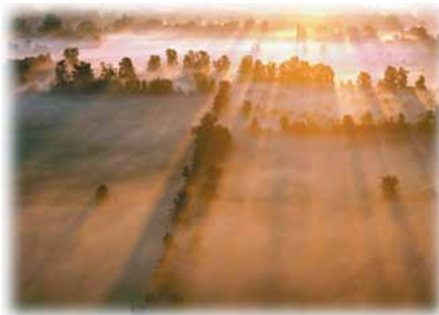
Jesus kehrt zurück und etabliert das Reich Gottes auf Erden – seine tausendjährige Friedenherrschaft, das Millennium.

Der Begriff, der an dieser Stelle mit „Bücher“ übersetzt wird, ist biblia . Aus der gleichen Wurzel dieses griechischen Wortes entstammt auch unser deutscher Ausdruck Bibel. Nachdem Gott diese Menschen aufer-