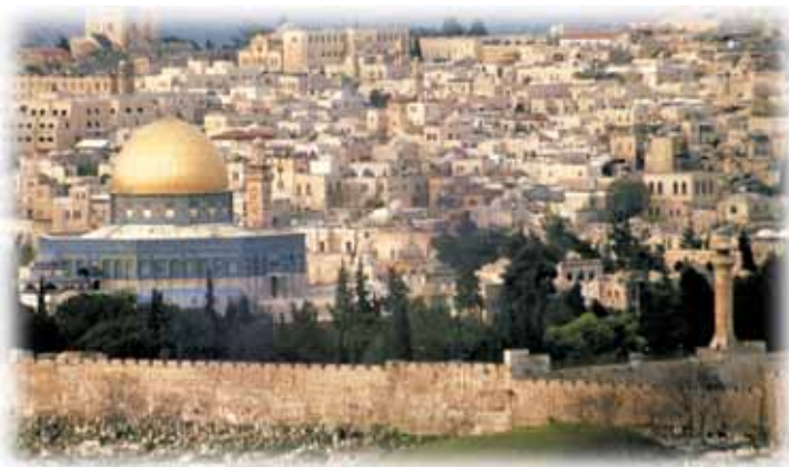
Als heilige Stadt dreier Weltreligionen steht Jerusalem im Mittelpunkt des Weltgeschehens unmittelbar vor der Wiederkehr Jesu Christi.

Ein Engel ruft dann Aasgeier zusammen, damit sie sich über das Fleisch dieser Armeen hermachen (Offenbarung 19,17-18. 21). Dann wurde „das Tier . . . ergriffen und mit ihm der falsche Prophet, der vor seinen Augen die Zeichen getan hatte, durch welche er die