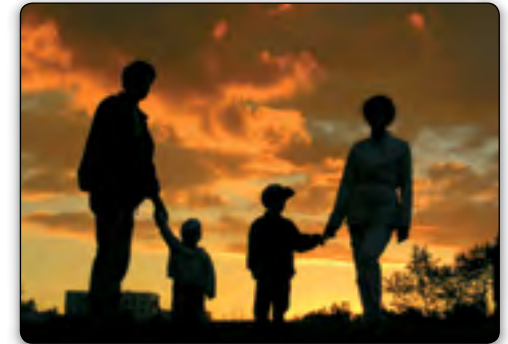
Die menschliche Familie ist ein kleineres Modell der größeren geistlichen Realität – dass Gott eine Familie ist, mit Jesus Christus als „Erstgeborenem unter vielen Brüdern“.

Gott vollbringt diese Transformation durch die Kraft des heiligen Geistes . Ein biblischer Begriff für diese Transformation ist das Heil . Paulus beschreibt diejenigen, die das Heil als die Kinder Gottes erlangen werden: „Der Geist [Gottes heiliger Geist] selbst gibt Zeugnis unserm Geist [unserem individuellen menschlichen Geist], dass wir Gottes Kinder sind. Sind wir aber Kinder, so sind wir auch Erben, nämlich Gottes Erben und Miterben Christi , wenn wir denn mit ihm leiden, damit wir auch mit zur Herrlichkeit erhoben werden“ (Römer 8,16-17).