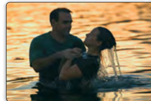
Die Bibel lehrt, dass wir umkehren – uns von unseren egoistischen Wegen abwenden – und getauft werden müssen, um die Gabe von Gottes heiligem Geist zu empfangen, die uns befähigt, ein neues Leben des Gehorsams gegenüber Gott zu führen.

• Gottes Geist inspiriert ein tieferes Verständnis von Gottes Wort, Vorsatz und Willen. Wie 1. Korinther 2, Verse 9-11 uns sagt: „Sondern es ist gekommen, wie geschrieben steht: Was kein Auge gesehen hat und kein Ohr gehört hat und in kei-