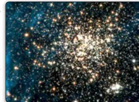
Der Prophet Daniel schrieb, dass die auferstandenen Kinder Gottes „werden leuchten . . . wie die Sterne immer und ewiglich“ als seine verherrlichten, unsterblichen Kinder!

Obwohl ertretete menschliche Wesen wahrhaft zur Existenz auf der Ehrfurcht gebietenden göttlichen Ebene als wahre Kinder Gottes und volle Mitglieder der