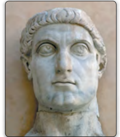
Der römische Kaiser Konstantin, der keine echte Bekehrung zum Christentum erlebte, berief das Konzil von Nizäa ein, das den Grundstein für die Akzeptanz der Dreieinigkeit legte.

Das waren die Umstände, unter denen die Doktrin von der Dreieinigkeit entstand. In diesen frühen Jahrzehnten nach Jesu Christi Tod und Auferstehung und im Laufe der nächsten Jahrhunderte gab es unterschiedliche Vorstellungen über seine Wesensart.