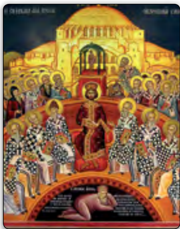
Dieses Gemälde in einem griechischen Kloster zeigt Konstantin (in der Mitte des Bildes) beim Konzil von Nizäa. Unter ihm sieht man den gedemütigten Arius, dessen Gottesbild auf dem Konzil abgelehnt wurde.

Wir möchten hier ausdrücklich darauf hinweisen, dass die wahre Kirche Gottes in diesen frühen Jahrhunderten an den intellektuellen und theologischen Debatten, die zur Ausformulierung der Dreieinigkeitslehre führten, nicht beteiligt war. Sie war bereits vorher in den Untergrund gedrängt worden (vgl. dazu das Kapitel „Der Aufstieg eines anderen Christentums“ in unserer kostenlosen