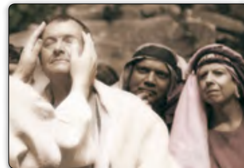
Die Heilige Schrift beschreibt den heiligen Geist in erster Linie als die Kraft Gottes – die Kraft, mit der Jesus und die Apostel große Wunder vollbrachten, wie die Wiederherstellung des Augenlichts von Blinden.

Symbolisch mit Jesus in dem Wassergrab der Taufe begraben, führte Paulus jetzt ein Leben, das nicht länger sein eigenes war. Er beschrieb sein transformier-