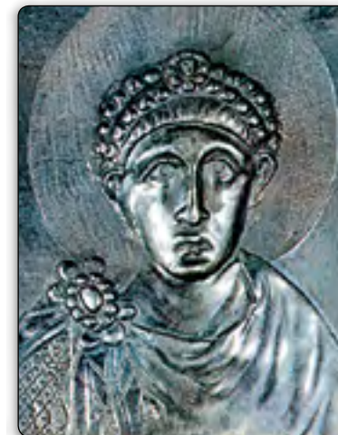
Der römische Kaiser Theodosius I. setzte den Beschluss des Konzils von Konstantinopel durch, der die Trinität als offizielle Lehre der Kirche festschrieb. Alle anderen Ansichten über Gott wurden als ketzerisch verurteilt und würden nicht toleriert.

Daher war Kaiser Theodosius – der selbst nur ein Jahr zuvor getauft worden war, bevor er das Konzil einberief, wie es Konstantin nahezu sechs Jahrzehnte zuvor getan hat –, entscheidend für die Festlegung wichtiger Kirchenlehren. Wie es der Historiker Charles Freeman formulierte: „Es ist wichtig zu verstehen, dass Theodosius selbst keinerlei theologischen Hintergrund hatte und eine Formulierung als Dogma bestimmte, die unlösbare philosophische Probleme enthielt, von