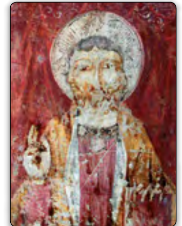
Auf diesem Fresko des 13. Jahrhunderts in Perugia, Italien sieht man die Dreieinigkeit als Wesen mit den Gesichtern des Vaters, Sohnes und heiligen Geistes.

Zum Beispiel schreibt der Theologieprofessor James White: „Wir machen das wahre Heil eines Menschen abhängig von der Akzeptanz dieser Lehre . . . Niemand wagt es, die Dreieinigkeit in Frage zu stellen, weil man sich fürchtet, als ‚Ketzer‘ gebrandmarkt zu werden . . . Wir müssen die Dreieinigkeit kennen, verstehen und lieben, um völlig und vollständig Christ zu sein“ ( The Forgotten Trinity , 1988, Seite 14-15; Hervorhebungen durch uns).