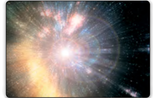
Die Bibel offenbart, dass das göttliche Wesen, das später als Jesus Christus auf der Erde lebte, derjenige war, der „alle Dinge erschaffen hat“ und als Gott mit den Menschen im Alten Testament interagierte.

Diese Bibelstelle ist allumfassend. Jesus schuf alles, „was im Himmel“ ist – das gesamte Engelreich, welches eine unzählbare Anzahl von Engeln umfasst. Dazu