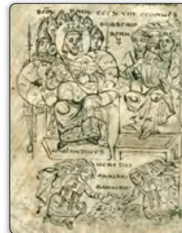
Dieses Manuskript aus dem 9. Jahrhundert zeigt Konstantin (oben links) bei der Aufsicht einer Verbrennung arianischer Bücher nach dem Konzil von Nizäa.

Karen Armstrong erklärt in ihrem Buch A History of God : „Als sich die Bischöfe am 20. Mai 325 bei Nizäa versammelten, um die Krise zu bewältigen,