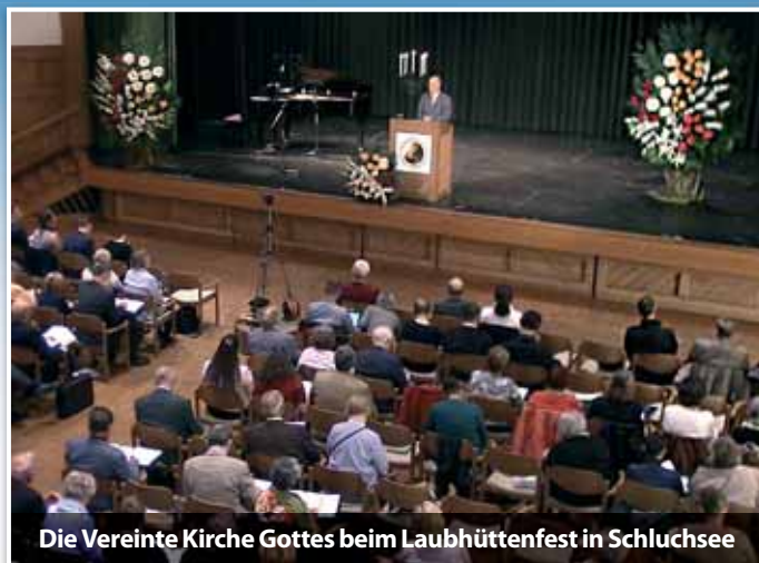
Die Vereinte Kirche Gottes beim Laubhüttenfest in Schluchsee