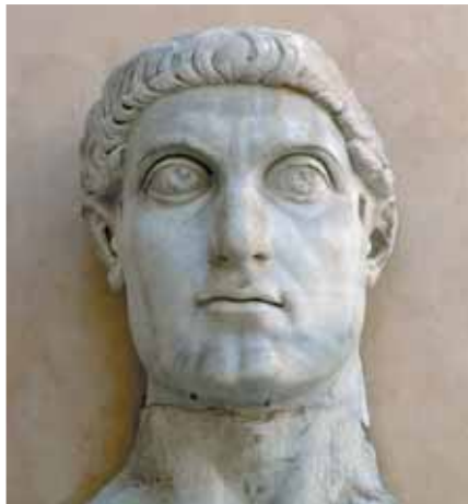
321 n. Chr. verfügte der römische Kaiser Konstantin die Verlegung des wöchentlichen Ruhetags vom biblischen Sabbat (Samstag) auf den Sonntag.

Unter seiner Oberaufsicht wurde auf dem Konzil von Nizäa (325 n. Chr.) die biblische Feier des Passahs zugunsten des von Menschen geschaffenen Osterfestes verworfen, das mehr und mehr heidnische Bräuche aufnahm.