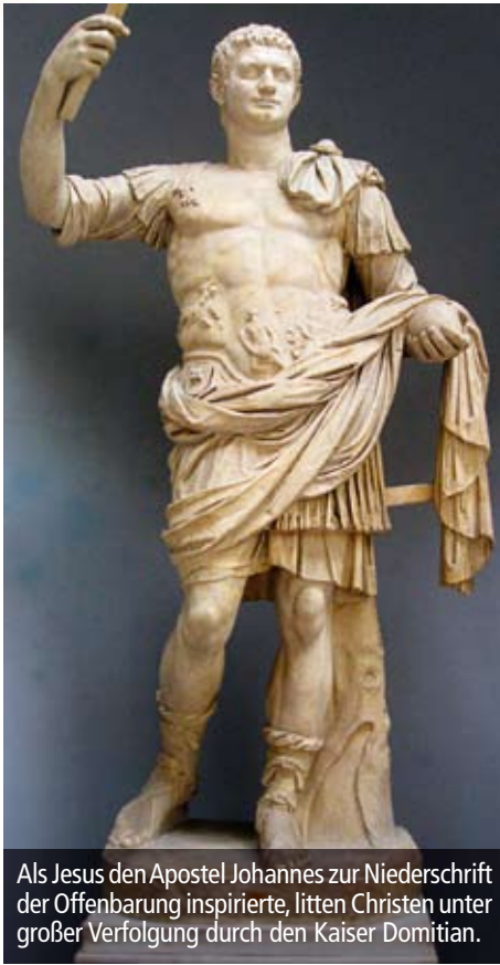
Als Jesus den Apostel Johannes zur Niederschrift der Offenbarung inspirierte, litten Christen unter großer Verfolgung durch den Kaiser Domitian.

Jesu in Matthäus 5 in unserer persönlichen Lebensführung nicht beherzigen.