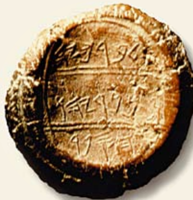
Dieser Abdruck vom Siegel Baruchs, der dem Propheten Jeremia als Schreiber diente, ist ein dramatischer Beweis für die Existenz dieser biblischen Persönlichkeit. Ein Fingerabdruck auf der linken Seite könnte sogar von Baruch selbst stammen.

1982 wurden bei Ausgrabungen in Jerusalem 51 Tonsiegel in einem Versteck gefunden. Sie wurden zur Versiegelung von Papyrus- und Pergamentrollen verwendet. Eines der Siegel