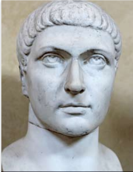
Büste Konstantins im Vatikanischen Museum

kann im prophetischen Zusammenhang ein „Tag“ einem Jahr entsprechen (siehe 4. Mose 14,34; Hesekiel 4,6). Somit kann dieser in Offenbarung 12 erwähnte Zeitraum sich tatsächlich auf die Zeit beziehen, in der die Kirche vor der teuflischen Verfolgung für diesen schrecklichen Zeitraum von 1260 Jahren fliehen musste, bis das finstere Mittelalter endete und eine neue Zeit der religiösen Toleranz begann.