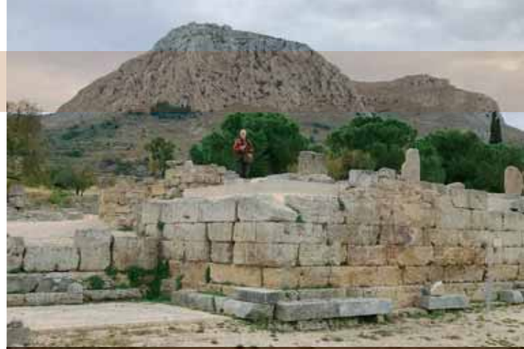
Der Autor steht auf dem dem „Richterstuhl“ in Korinth, wo Paulus vor dem Prokonsul Gallio angeklagt wurde (Apostelgeschichte 18,12-18).

wird aber von mancher Seite eingewandt, die Hinweise auf berühmte Figuren seien nachträglich in die biblischen Texte eingefügt worden.