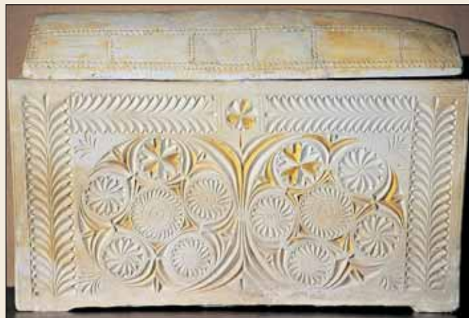
Die Evangelien berichten uns, dass der Hohepriester, der den Tod Christi plante, Kaiphas hieß. 1990 fanden Archäologen diesen Knochenkasten mit dem Namen Kaiphas.

Archäologen haben somit die Wirklichkeit dieser wichtigen neutestamentlichen Persönlichkeit belegt. Damit wurde ►