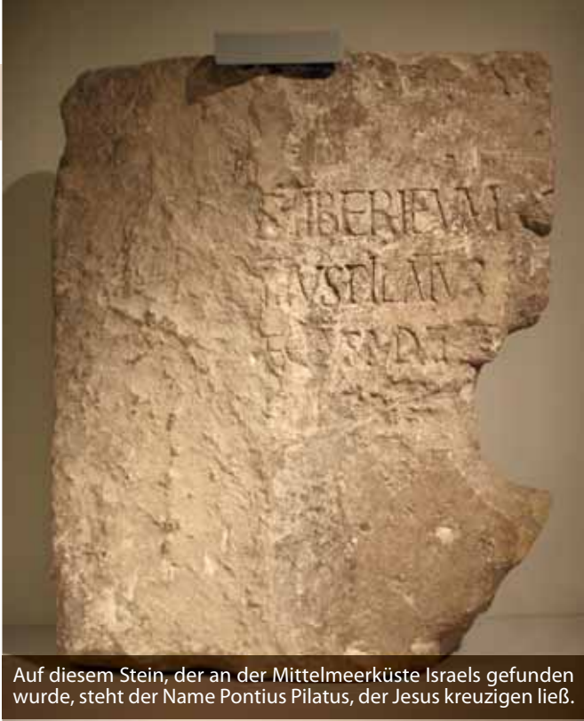
Auf diesem Stein, der an der Mittelmeerküste Israels gefunden wurde, steht der Name Pontius Pilatus, der Jesus kreuzigen ließ.