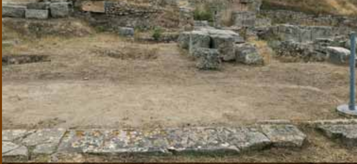
Auf einem der Pflastersteine im Vordergrund in der antiken Stadt Korinth steht in einer Inschrift der Name Erastus (Römer 16,23).