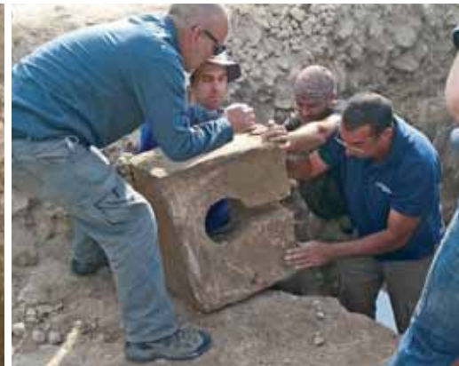
Fotos (von links): Die Freilegung einer Kelter in der Nähe von Jesreel ist ein Hinweis auf Nabots Weinberg. Er wurde ermordet, weil er den Weinberg nicht verkaufen wollte (1. Könige 21);