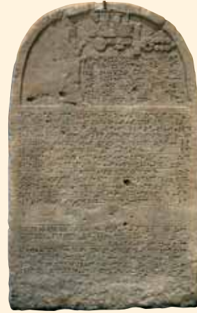
Diese antike assyrische Stele zeigt König Sanherib bei der Anbetung seiner Götter.