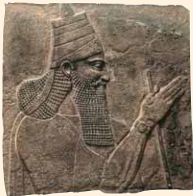
Diese Abbildung des assyrischen Königs Tiglat-Pileser III. fand man in seinem Palast in Nimrud Jahrhunderte nach seiner Invasion Israels.

Adrammelech, assyrischer Prinz Ahab, König von Israel Ahas, König von Juda Ahasja, König von Israel Ahasveros (Griechisch: Xerxes), König von Persien Apries, Pharao von Ägypten Artahsasta (Griechisch: Artaxerxes), König von Persien Asarhaddon, König von Assyrien